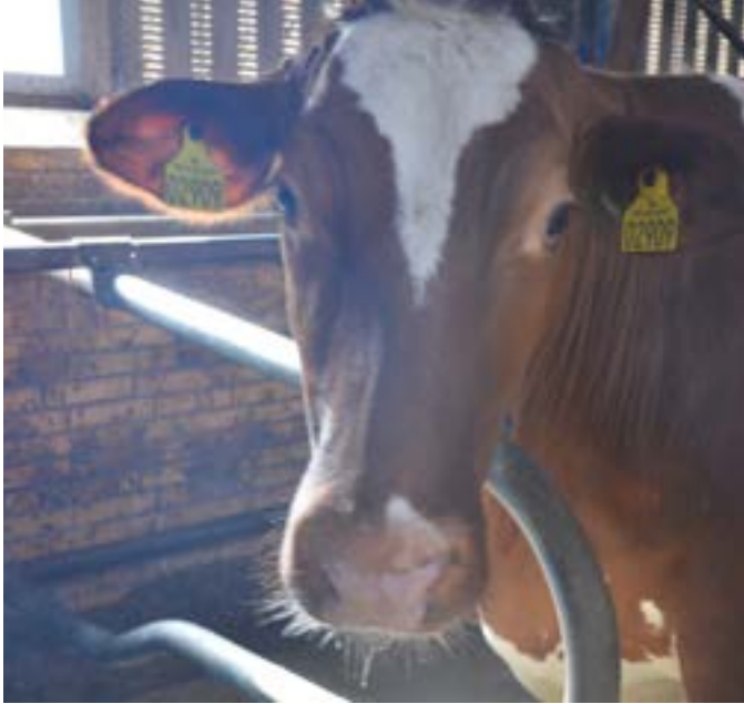
Køernes trivsel er uden tvivl forbedret