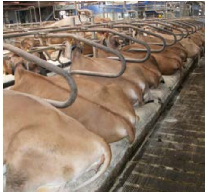
Hos Forskningscentret i Foulum, har man også valgt at montere CowTex madrasser til køerne.